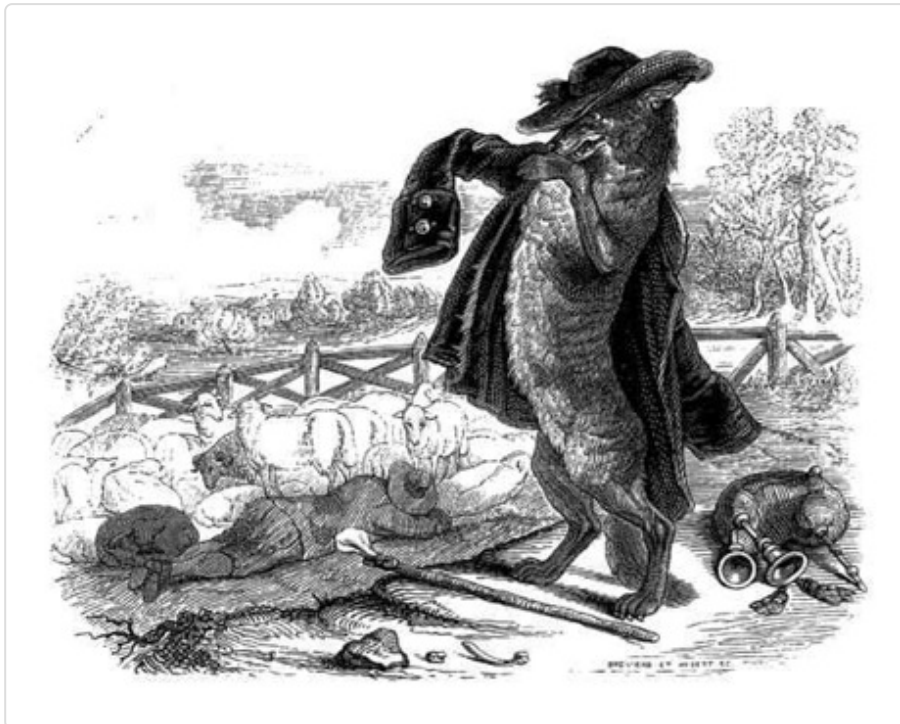
Le Loup devenu berger, J.J. Grandville

Gravure de Grandville pour l'illustration des « Fables » de La Fontaine (1838-1840)