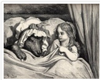
Le Petit chaperon rouge, Gustave Doré

Gravure de Grandville pour l'illustration des « Fables » de La Fontaine (1838-1840)