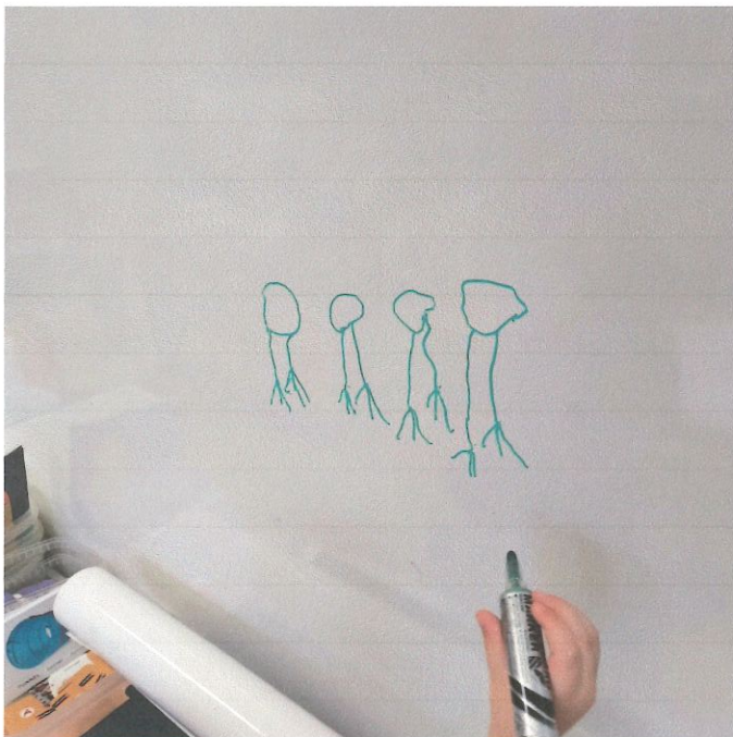
Phase collective d'explications des recherches en binôme.