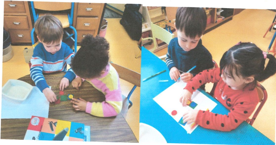
Recherche des différentes combinaisons possibles en manipulant des carrés et disques de couleurs.