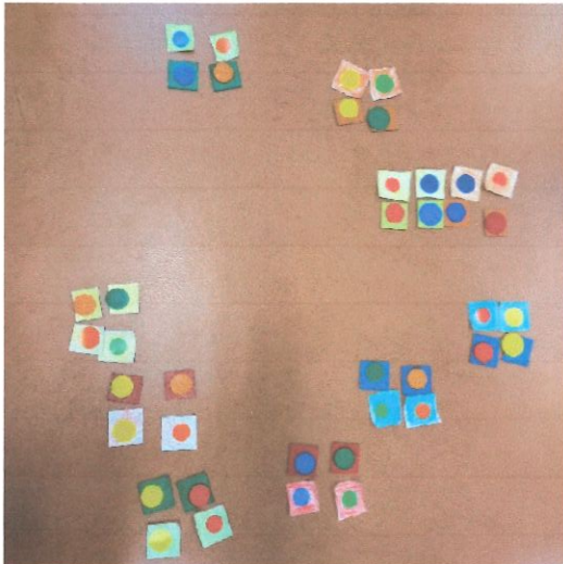
Tri des combinaisons trouvées pour enlever les doublons puis coloriage d'un carré et collage d'une gommette dessus pour conserver le travail de manipulation.