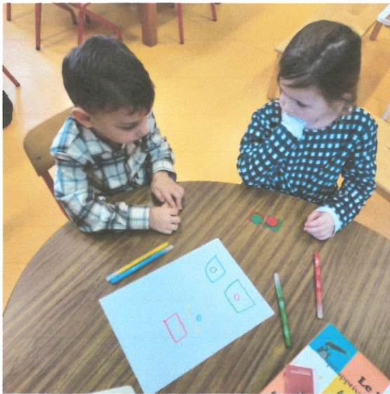
Dessins des combinaisons trouvées et recherche de nouvelles combinaisons possibles ; différentes de celles dessinées.