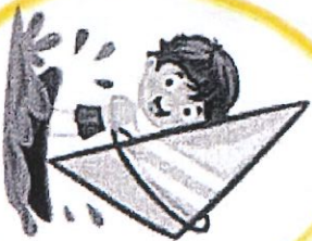
PLANCHE A VOILE